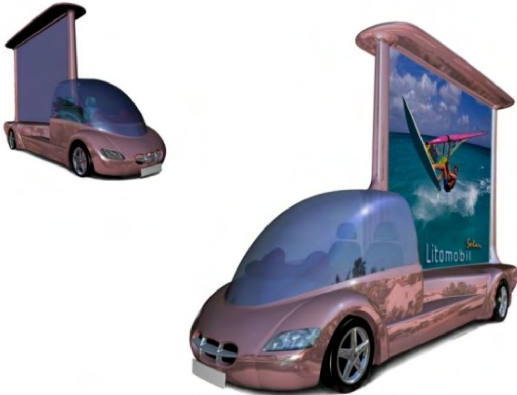
Bild 1. Litosolarmobil 12.2001

Auf Basis eines verlängerten Käferchassis entstand das futuristische Litosolarmobil.